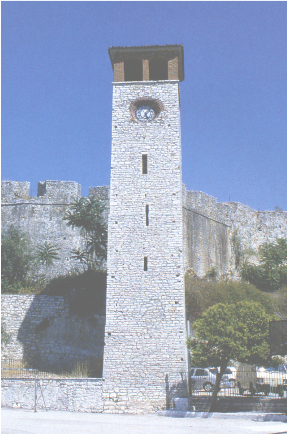
Ο πύργος του ρολογιού της Άρτας κοντά στην είσοδο του κάστρου.